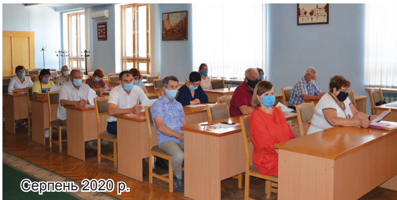
Серпень 2020 р.